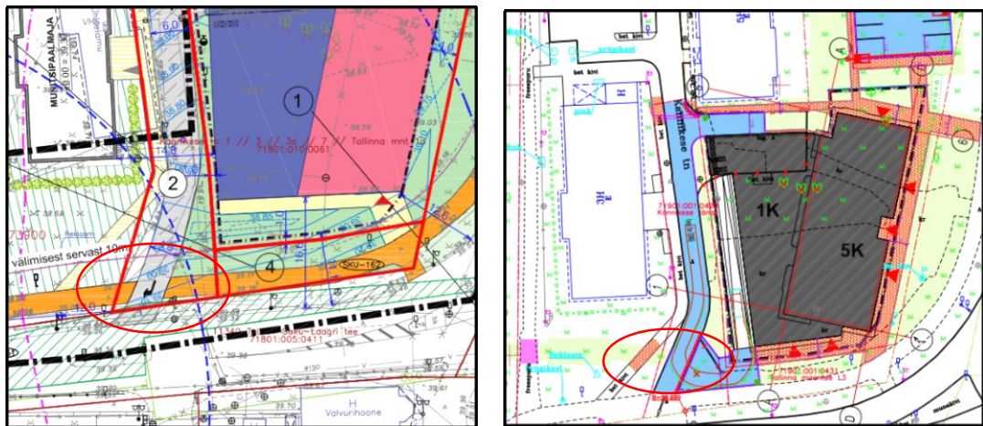
Joonis 2. Väljavõte planeeringu põhijoonisest ja projekti liikluskorralduse joonisest